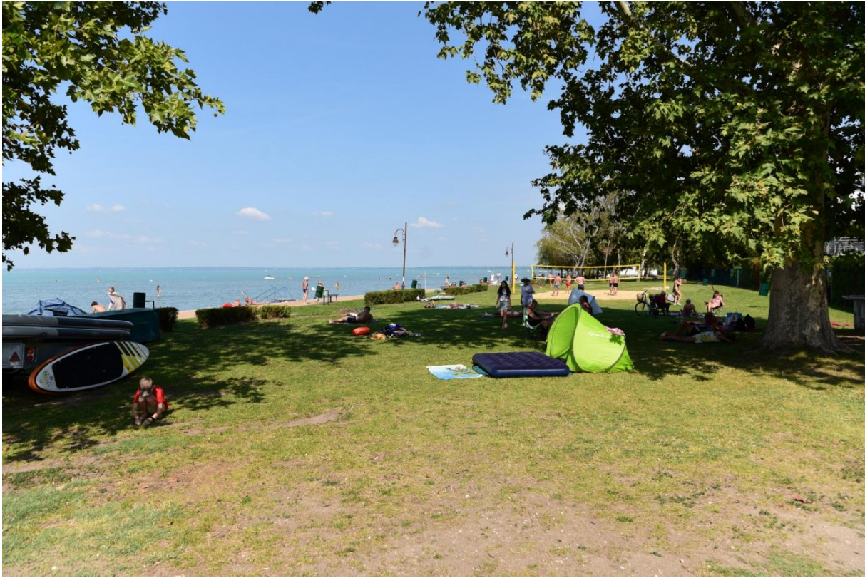
Sóstói strand: Az fürdővíz légi fényképe